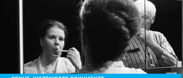
FOKUS: INSZENIERTE DOKUMENTE